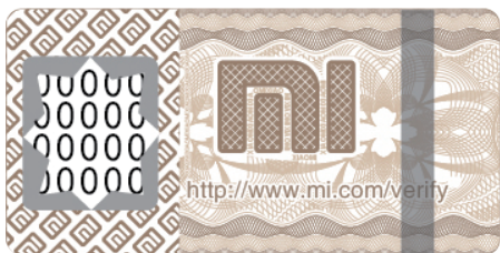
Étiquette à gratter

Pour plus d'informations, consultez le site www.mi.com